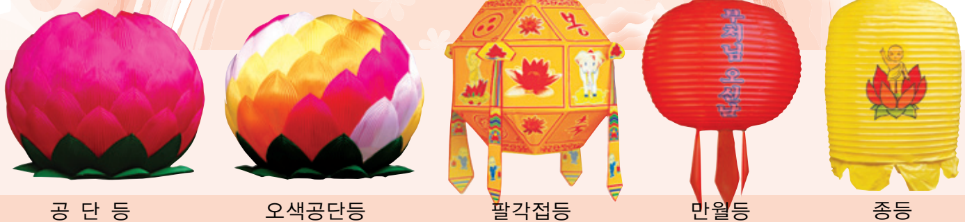
공 단 등