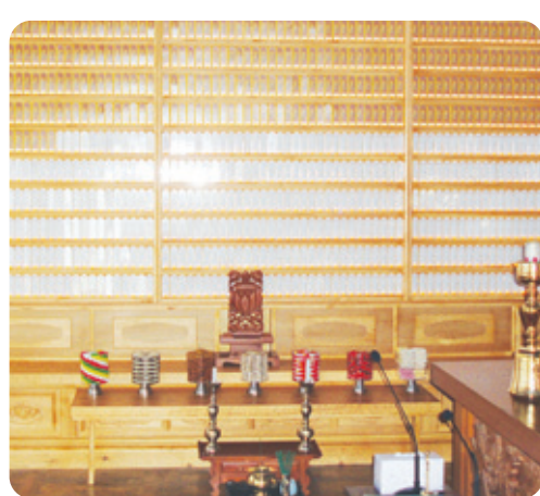
용학사 목련관 위패