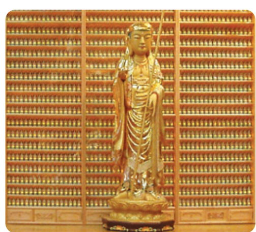
마산 금강정토사 LED인등