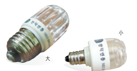
1년 365일, 하루 6시간 사용 시공요금: 98원/1kw/h