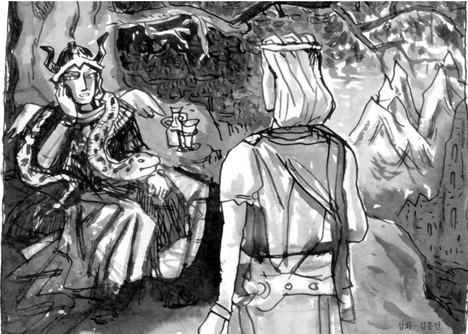
삽화 · 김홍인

무니는 깜짝 놀라 칼키를 쳐다봤다. 그는 또 다시 심긋 미소를 지어 보였다.