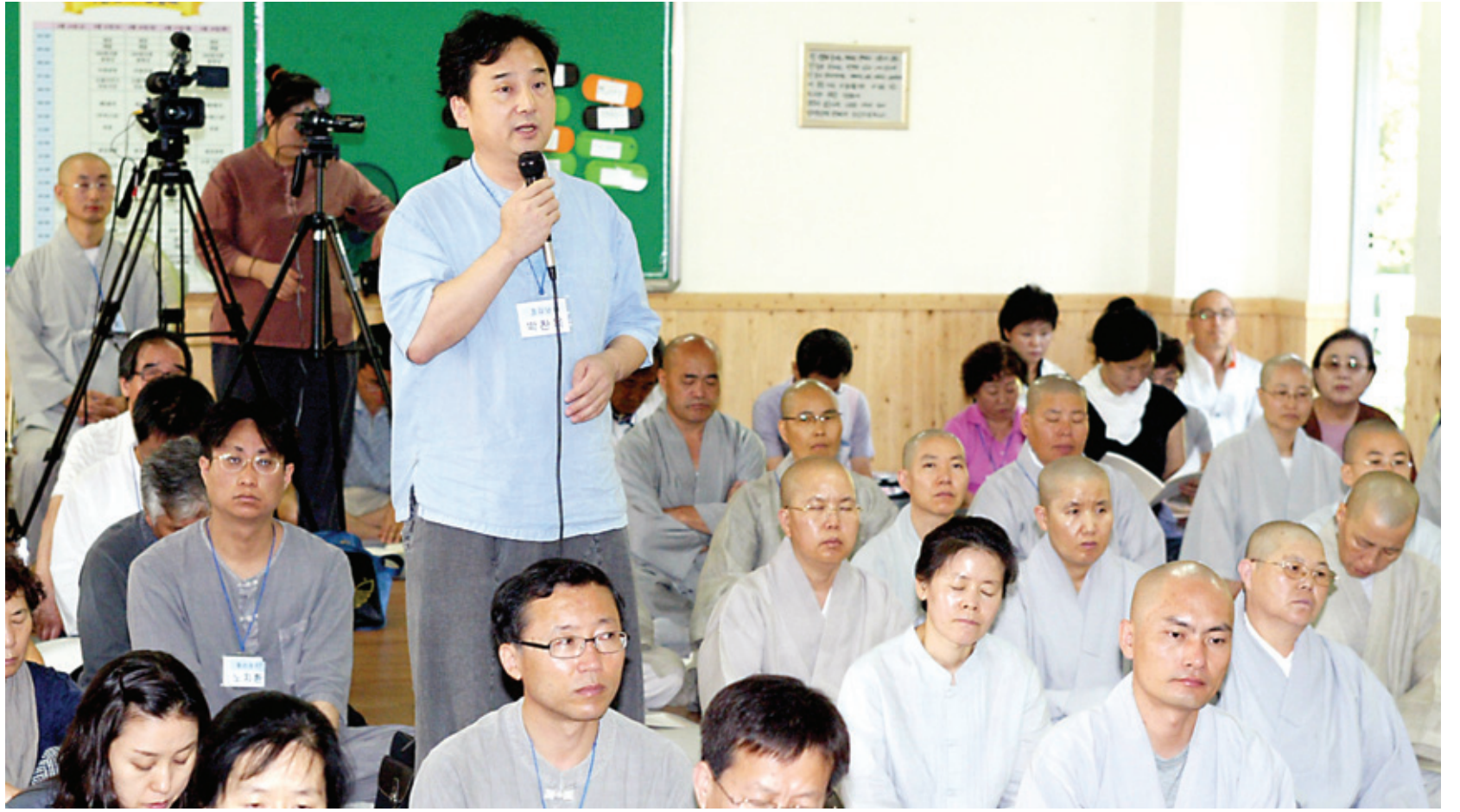
2009년 본사와 '민족성지 지리산을 위한 불교연대 준비위원회'가 공동 주최한 지리산아산법석에서 혜국 스님의 법문이 끝난 후 한 재가자가 스님께 질문을 하고 있다.

조실이 방장이 설법할 때, 또는 언제라도 학인이 묻고 답하는 것은 거의 상례화 되어 있다. 이것을 '빈주문수(賓主問酬)'라고 하는데, 학인(賓)이 묻고(問) 선사(主)가 답한다(酬)는 뜻이다. <임제록>에 나오는 '빈주역연(賓主歷然, 주객이 돌이로구나)'이라는 말도 학인(賓)과 선사(主)를 가리킨다. 크게 예의에 어긋나지 않는다면, 즉 예의를 갖춘다면, 어떤 경우든 어떤 질문이든 문제시 하지 않는다. 그것이 곧 선문답, 범거랑이다. 격조 있는 질문이라면 주지로서는 그 이상 반가운 일도 드물 것이다. 방장실을 노크하여 질문할 정도라면 그는 이미 투철한 수행자임에 틀림없다. 깨달을 날이 그다지 멀지 않았다고 평해도 무리는 아닐 것이다.