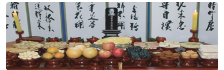
주문시 사진은 메일이나 우편으로 보내주시면 제작 후 택배로 보내드립니다.

◆ 제사 때나 명절에 지방위패에 조상님의 사진과 함께 제작한 지방으로 제사를 모시면 생전의 모습을 잊지 않을 것이며, 지방을 쓰는 번거로움이 없습니다. 흑옥(黑玉)과 흑단 나무를 부착하여 제작하였기에 영구적으로 보존 하여 사용할 수 있습니다.