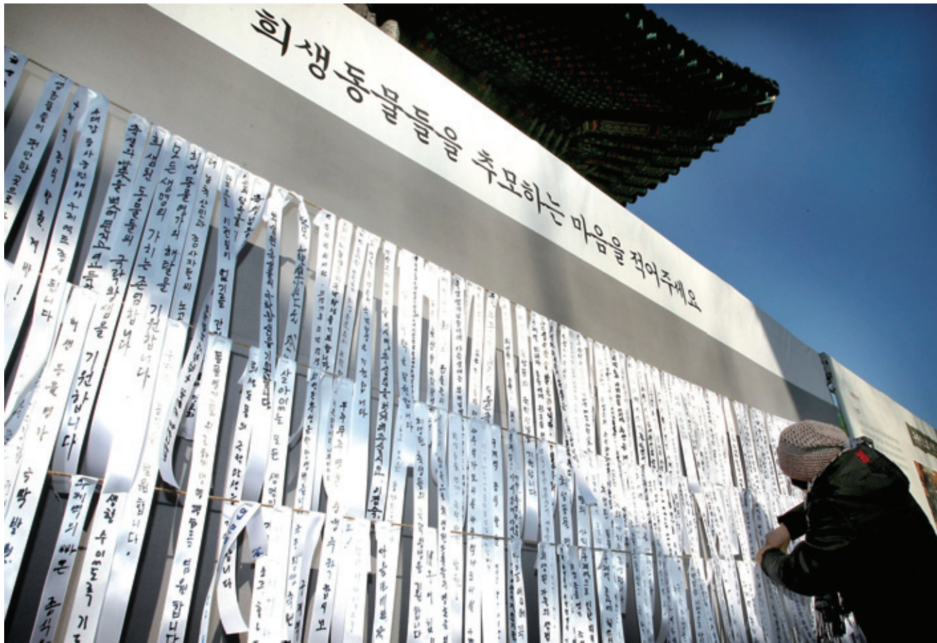
다 같은 생명! 구제역으로 인해 실추된 가축의 수가 200만 마리를 넘어선 가운데 조계종 직할교구(직할교구장 총무원장 자승)는 1월 19일 서울 조계사에서 '구제역 종식 발원 및 희생동물 천도제'를 봉행했다. 종단 중앙총무기반 소임 스님과 구제역 피해 농축산민, 동물보호협회 관계자 등 천도제에 참석한 1000여 사부대중은 하루빨리 구제역이 종식되기를 기원하며 희생동물들의 넋을 위로했다. 행사 참가자들은 희생동물을 추모하는 서원지를 달고 극락왕생을 기원했다.