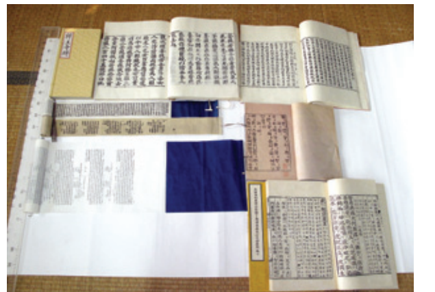
김표영 선생이 제작한 불교서적들. 맨 왼쪽 뒷줄은 석왕사비를 탁본한 <석왕사비> 경첩, <금강반야바라밀경>. 두 번째 줄은 권자본 형식의 <다라니경>과 <월인천강지곡>, 세 번째 줄은 <대방광불화엄경> <능엄경>이다.