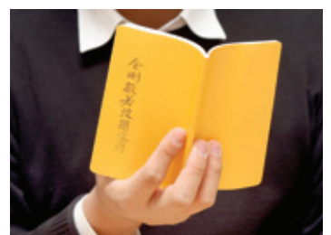
독송회에서 만든 <금강경>은 크기가 작아 휴대하며 읽을 수 있다.

사신 유사와 명관 스님이 경장과 논장 1700여 권을 가져온 사실과 진흥왕 37년(서기 576)에 안흥법사가 중국에서 구법하고 돌아올 때 <능가경>과 <승만경>을 가져왔다는 사실로 미루어 이때를 전후한 전래된 것으로 보고 있다.