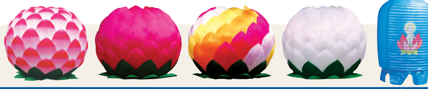
칼라(보카시)연등 공단등 오색공단등 영가등 종등 ※ 주름등·종등 주문 받습니다. (사찰명 인쇄)