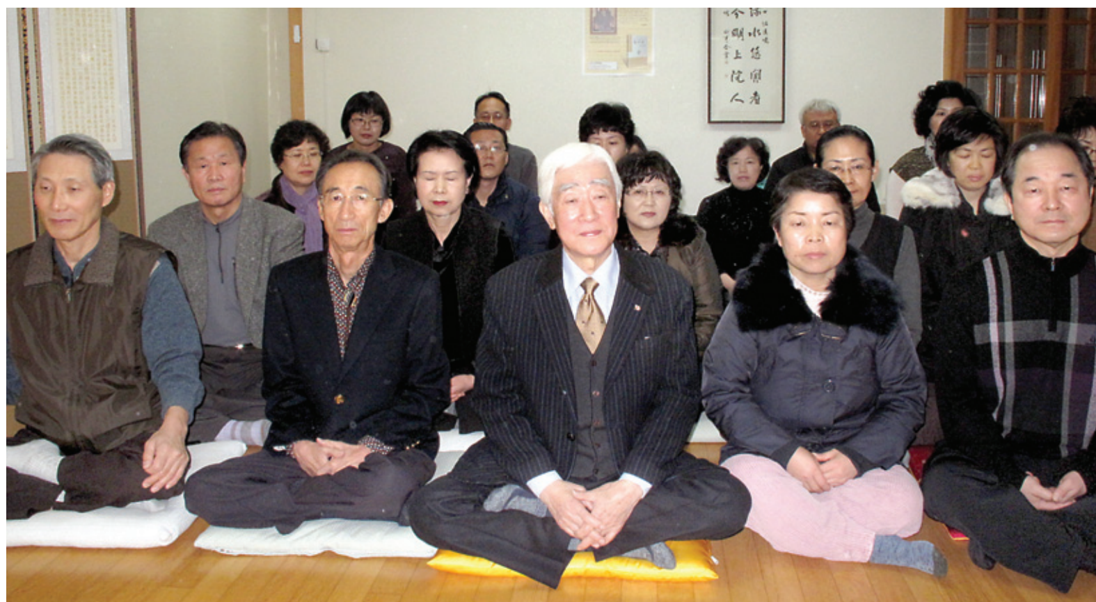
금강경독송회는 매월 1·3째주 일요일 송내 법당에서 법회를 병행한다. 법당에서 재가 신도들이 법문을 듣는 모습.