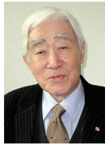
사경 보시 인연, 소재자 발간해 '금강경'은 인류 구제하는 경전