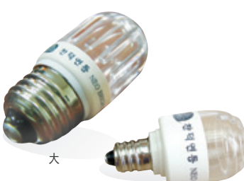
1년 365일, 하루 6시간 사용 전기요금: 98원/kwh