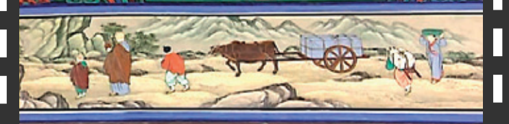
◀대장경은 나무질이 일정하고 조직이 고른 것을 사용했다.