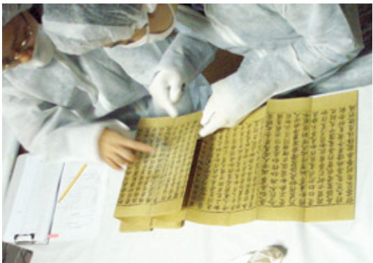
고려 초조대장경의 대부분이 일본에 보 부터

관된 이유는 뭘까? 남선사(南禪寺)를 포함한 일본 경도 지역 일부 사찰은 고려, 조선과 교류해 왔다. 이를 통해 대장경을 비롯한 각종 경전의 수집을 위한 노력도 계속됐다. 당시 한중일 삼국은 대장경을 완벽히 갖추는 것이 유행이었다.