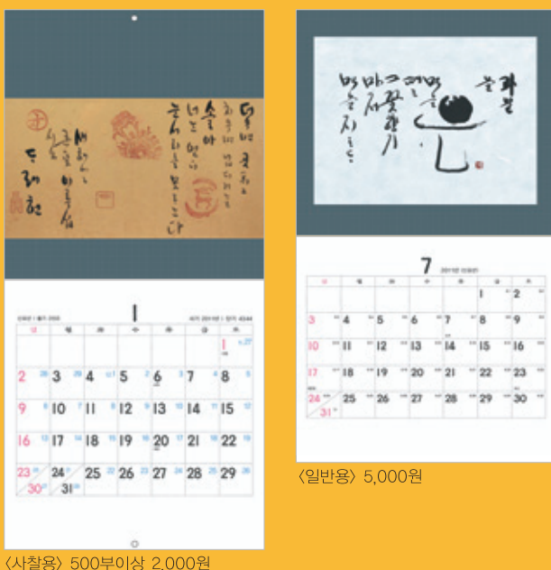
(사찰용) 500부이상 2,000원