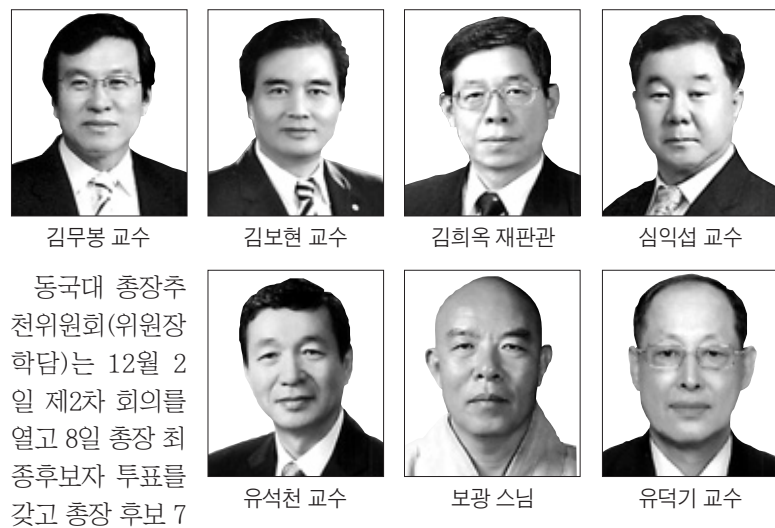
동국대 총장추천위원회(위원장 학담)는 12월 2일 제2차 회의를 열고 8일 총장 최종후보자 투표를 갖고 총장 후보 7명 가운데 3명을 주력 이사회에 추천하기로 했다. 조동섭 기자