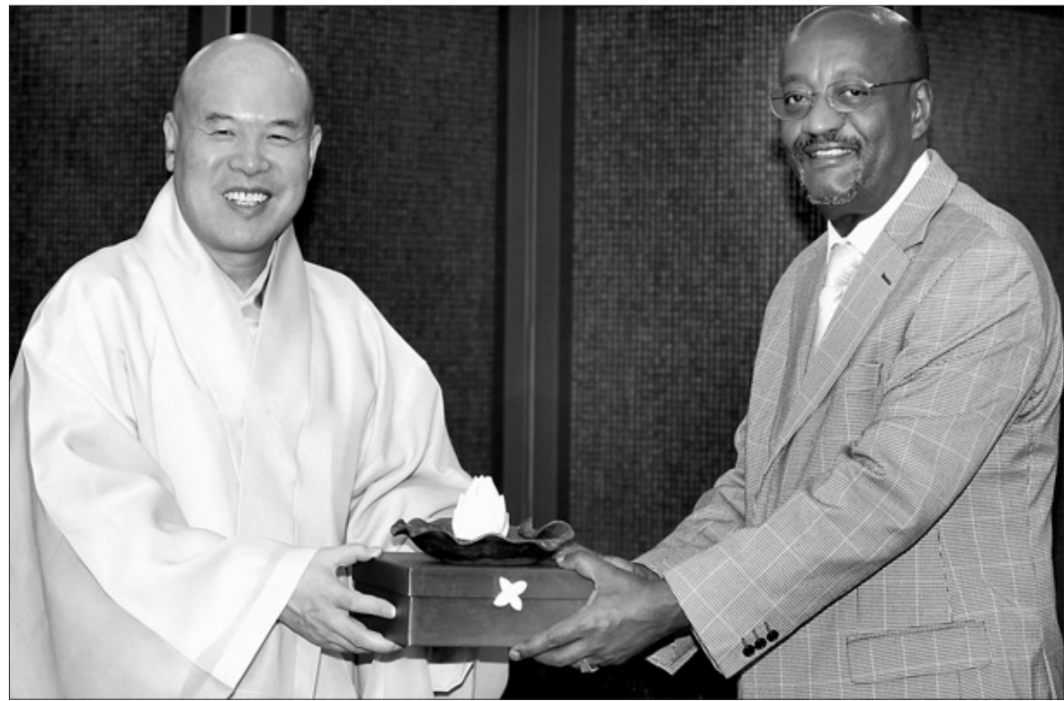
유네스코 사무부총장 자승 스님(왼쪽)은 12월 3일 한국불교역사문화기념관에서 엔기다 유네스코 사무부총장의 예방을 받고 “2013년 세계 종교지도자 포럼을 추진하고 있다. 유네스코의 많은 도움을 기대한다”고 말했다. 이에 엔기다 부총장은 “유네스코가 추구하는 비와 불교의 이상이 같다. 2013년 포럼 진행에도 유네스코의 지원을 기대하겠다”고 답했다. 글=조동섭 기자, 사진=박재환 기자

이와 함께 부서별 팀 통합과 신설도 발표했다. 재무부가 재무팀과 시설관리팀으로 변경된 것을 비롯해 법무전문위원실은 총무부에 통합됐다. 기획실 감사국은 감사팀으로 명칭 변경됐다. 포교원도 어린이청소년팀을 해체하고 전법지원팀으로 새로 꾸렸다.