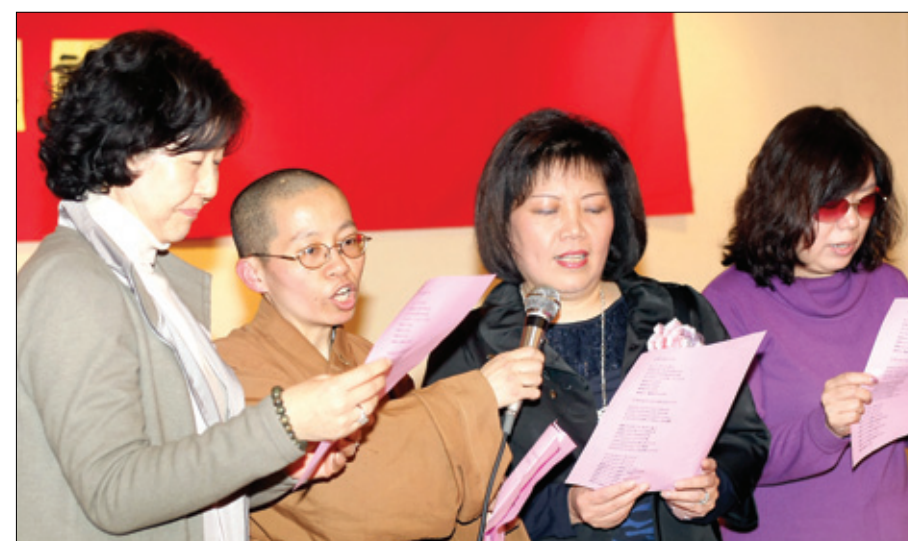
①바이올린 연주를 하고 있는 화교 어린이들. ②각한 스님(왼쪽에서 두번째)과 신도들이 함께 노래를 부르고 있다.