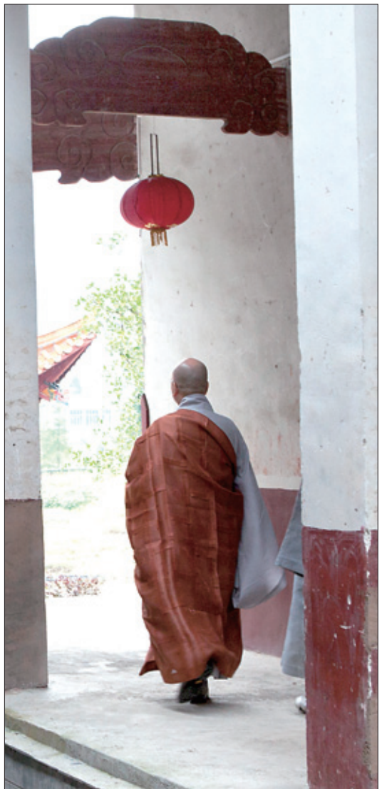
감회에 젖어 석상사 경내를 둘러보는 스님