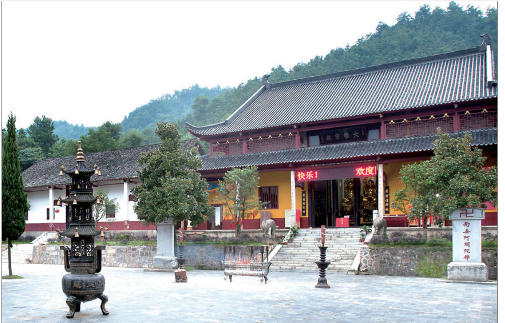
임제종 황룡파와 양기파의 발원지인 석상사

보살은 감정에 휘둘리지 않고 자기 파도 넘실넘실 타고 넘을 줄 알고 자기 이성과 의지대로 살아가는 것이 견성체행 이후의 변화라고 술회했다. 한 생 각 일으키기 이전에 이루어진다고 하니 주인공으로