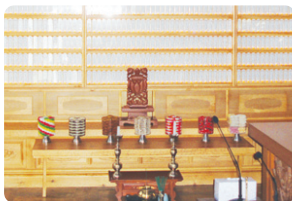
용학사 극락전 영구위패