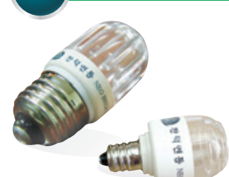
1년 365일, 하루 6시간 사용 전기요금: 98원/1kw