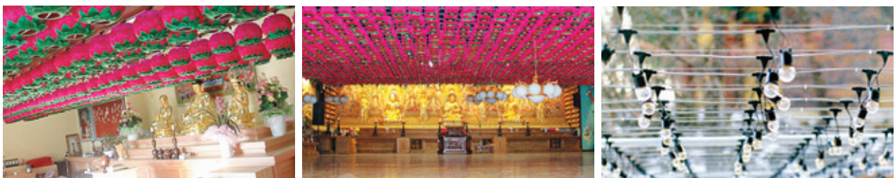
연등 자동 승강장치_ 대구 여래사