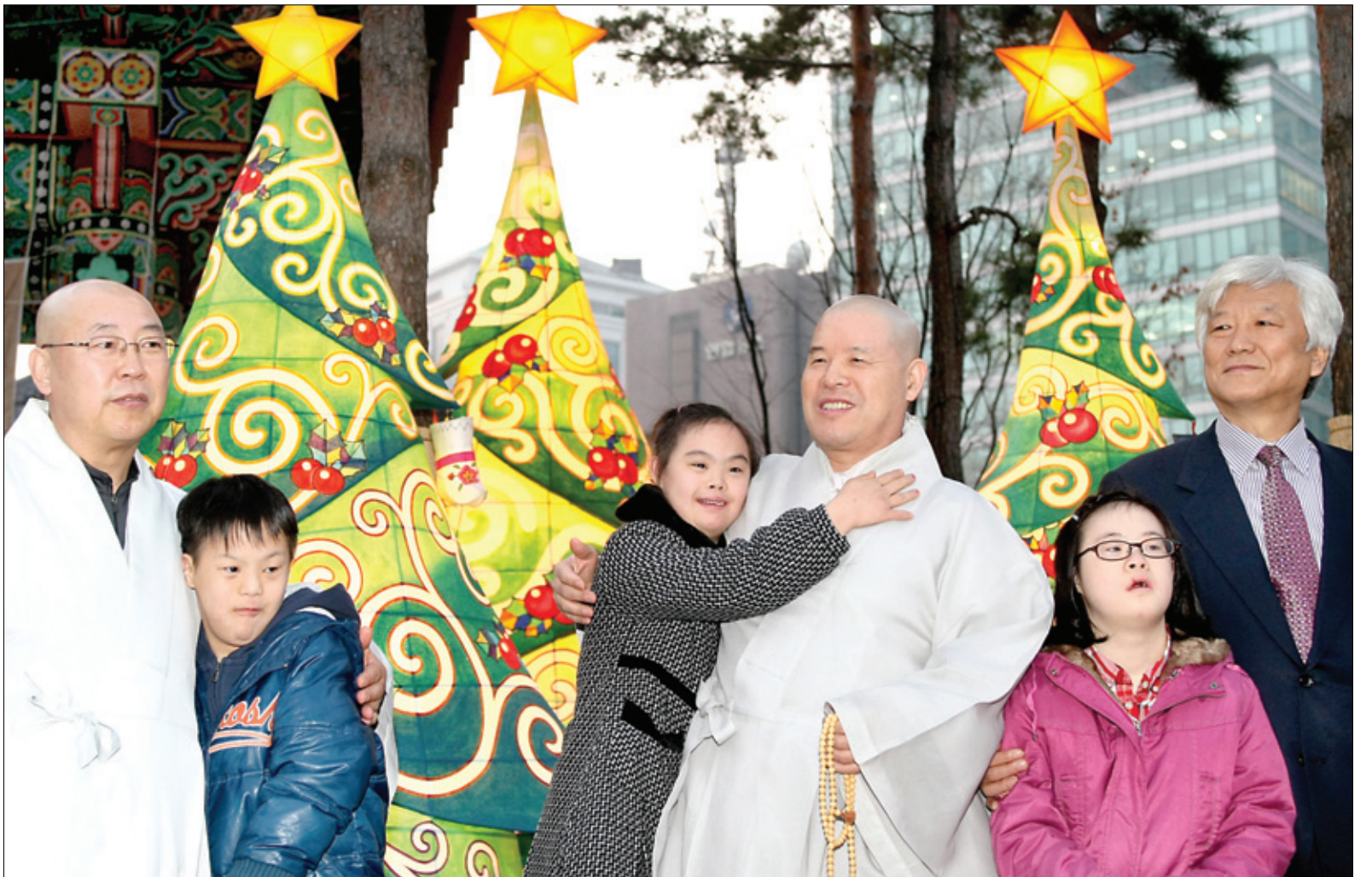
조계사에 성탄트리 점등