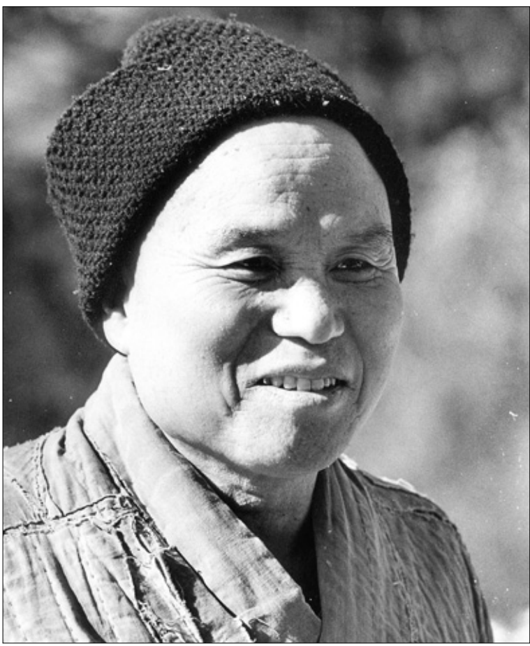
성철 스님은 관습적으로 행해져 온 신앙의 대상에 대한 신앙이 아닌 만인에 봉사하는 신앙을 제시했다.

김 교수는 “성철 스님이 불교신앙적인 측면에서 제시한 개혁방안은 지금까지 관습적으로 행해온 신