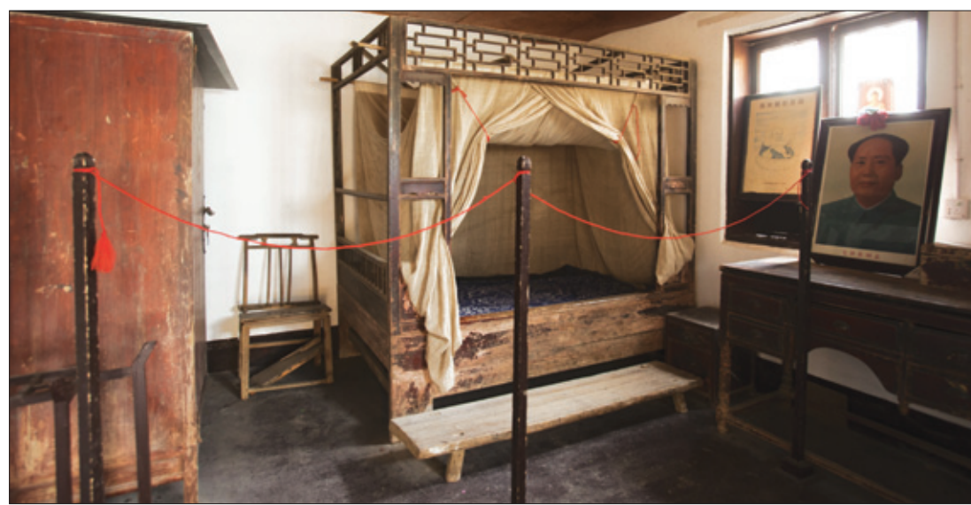
〈육조단경〉을 사숙하던 청년 모택동이 머물렀던 밀인사 곁방.

나에게 한 기쁨이 있어 눈 깜박하는 사이에 보네 이 이치를 깨닫지 못하는 이에게