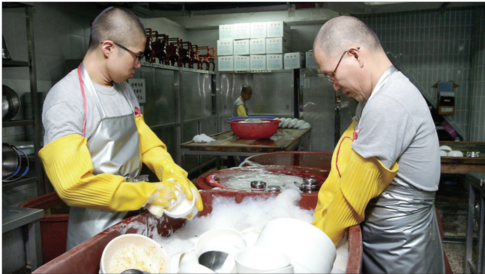
해인사 공양간에서 스님들이 공양 후 설거지를 하고 있다.

전좌, 대중공양 중시한 선원총림 음식 전담 직세는 도량과 당우 관리에 울력 동원 권한