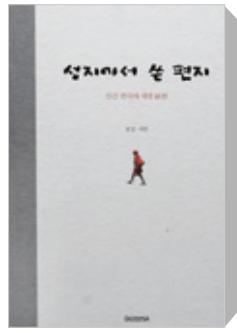
호진·지안 스님, 구법의 길에서 주고 받은 편지글 책으로 나와

호진 스님은 인도 여행기간 동안 지안 스님과 부처님의 참 모습에 대해 고민하며 진솔한 글을 주고 받았고, 이 글이 책으로 엮였다. <성지에서 쓴 편지>는 초기불교와 대승불교