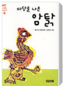
「마당을 나온 암탉」 황선미 지음 | 사계절

평소 가방을 좀 무겁게, 책을 두 세권 정도 꼭 넣고 다닌다. 빈손으로 다니는 것에 익숙해지면 게을러지거나 시간을 허비하지 않을까 하는 염려 때문이다. 주로 고전이나 사상이 같이 주제나 책 무게가 무거운 것, 경영서나 트렌드분석 혹은 미래예측 같은 실용서, 청소년 권장도서 성격의 가벼운 문고판 수준의 교양서 등 세 종을 섞어 가지고 다닌다. 그래서 지하철이나 버스 안에서, 약속시간까지 기다릴 때, 짬나는 시간의 길이나 해당 장소의 조건에 맞는 책을 선택해 독서를 한다. 이 이야기를 꺼낸 이유는 나의 글이 크게 세 갈래로 진행된다는 말을 하기 위한 것이다. 이 세 갈래 중에서 이번 주는 청소년 교양서 수준에서 어른과