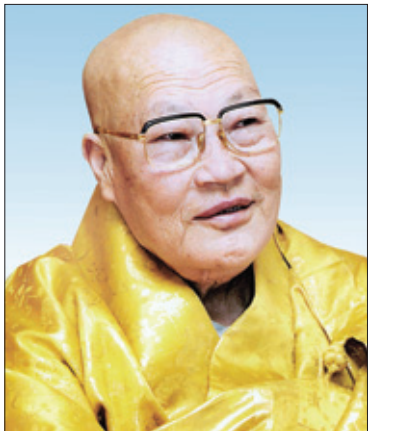
관음종 제7세 종정 죽산 대종사 입적