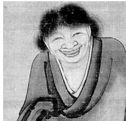
한산습득도 (寒山拾得圖) / 동경국립박물관 소장 중요문화재

두 사람은 다시는 국경사에 돌아오지 않았다. 이에 명령을 받은 관리가 한산의 바위굴을 찾아서 법의 두 벌과 향과 약품을 공양하자 한산은 큰 소리로 “들어오지 말라, 더 이상 들어오지 말라”고 말했다. 그리고는 더욱 깊은 곳으로 몸을 숨기고는 “그대들한테 부탁드립니다. 열심히 정진해 수행하시기 바랍니다.”는 말을 남기자 바위굴이 저절로 닫혀버렸다. 습득의 경우도 이후의 소식과 전기가 없이 다만 몇 수의 시만 남겼다고 한다.