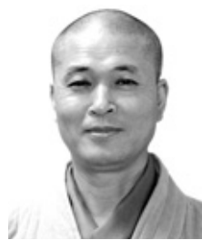
석우 스님의 조주록 선해 <45>