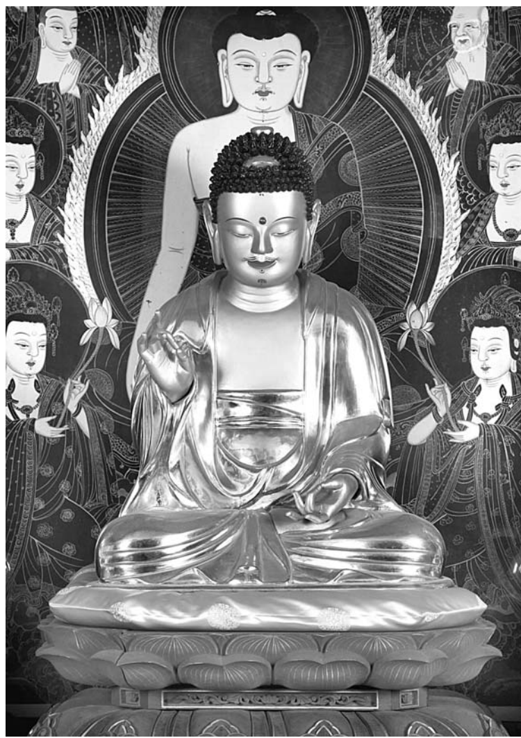
보물로 지정된 예고된 '진주 월명암 목조아미타여래좌상'