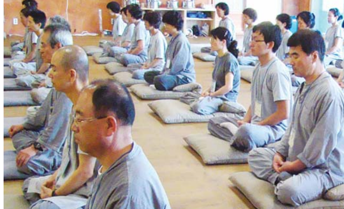
선방에서 정진하는 수련생