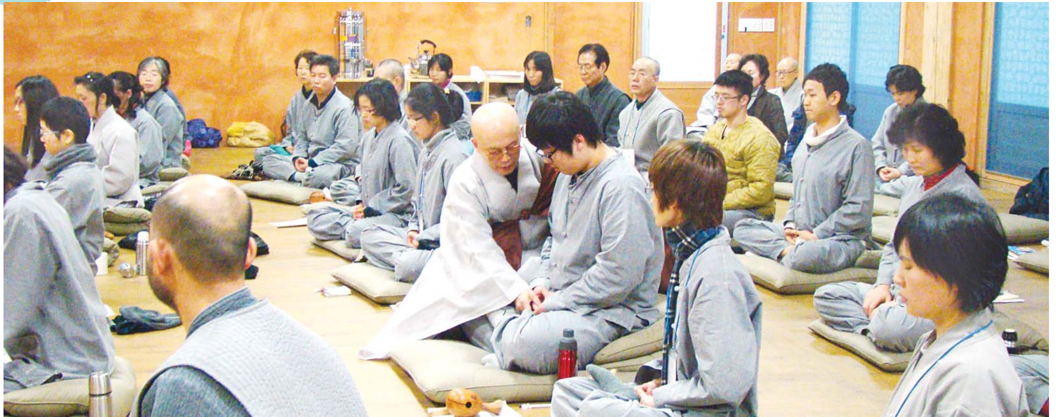
선원장 대표스님께서 참선을 지도하고 있다