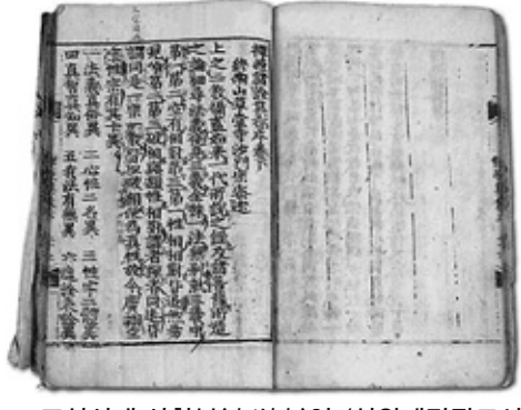
조선시대 사찰본(寺刹本)인 <선원제전집도서> 순천 선암사 소장.