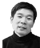
김호규 교수의 선어록 해제 23 선원제전집도서(禪源諸詮集都序)

이 문답 말미에서도 조주 스님은 그 특유의 돈오 사상을 그대로 드러냈다. 스스로 부처이고 완벽한 도대체 누구를 의지하겠다는 것이냐고 학승에게 일갈을 날린 것이다. 무불선원 선원장