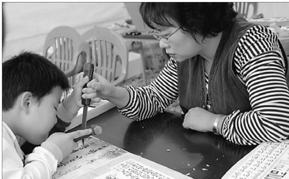
사찰이 불교콘텐츠를 갖고 지역축제를 여는 것은 문화포교의 좋은 예다. 사진은 해인사에서 주최한 팔만대장경축제에 참가한 어린이가 체험행사서 목판에 글씨를 새기는 방법을 배우는 모습.

법회의식에 찬불가, 불교무용 등의 활용 및 이에 대해 충분히 설명하여야 하며, 문화행사