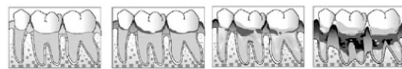
치주질환의 진행 과정. 왼쪽의 건강한 잇몸이 치은염, 초기 치주염을 거쳐 점점 악화되고 있다.

원인과 전신적인 원인으로 분류될 수 있는데, 대부분의 경우는 국소적인 원인이라 할 수 있다. 국소적인 원인은 구강 내 세균이 응집돼 형성되는 치태와 그것이 석회화된 치석으로 인한 경우이다. 전신적인 원인은 영양 결핍, 백혈병, 빈혈, 혈액장애, 당뇨, AIDS 등을 들 수 있다. 그럼 국소적인 원인인 치태란 무엇일까? 치태의 의학사전적 정의는 '이 에 끼는 세균, 침, 점액물 따위로 이뤄진 젤라틴 모양의 퇴적(堆積)'이다. 이러한 치태는 일상생활에서 만들어지는 자연적 현상이라 할 수 있지만 입을 행구는 것만으론 제거되지 않는