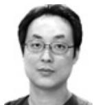
Dr. 황의 바른 자세 바른 생활 출산후 체형

음이 자주 반복될 경우, 잇몸이 부어 오르고 고름이 나는 경우, 이가 들뜬 느낌이나 혹은 이가 흔들릴 경우 등은 치주질환을 의심해야 한다. 치주질환을 방지할 경우 치아를 상실할 수도 있다. 하지만 치주질환은 손쉬운 방법으로 일상적인 예방 활동이 가능하다. 바로 치태 조절과 치석 제거가 그것이다. 구강질환의 원인을 제거하지 않고 진통제와 잇몸약 복용을 지속한다면 오히려 구강건강을 해치는 결과를 초래한다. 치료 진료와 병행한 적절한 약 복용이 구강건강의 바른 길이다. 연우치과 (02)733-1033