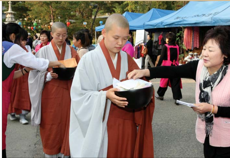
30여 명의 스님들이 봉녕사 큰 마당에서 탁발순례에 나섰다. 탁발을 통해 부처님 당시의 수행정신을 재현했다. 수행자는 하심과 인욕심을 키우고 공양자는 보시공덕을 짓는다.