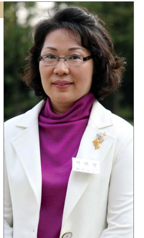
관음회 도인회 회장. 이날 도인회 회장은 뜻하지 않게 사찰음식 경연대회에서 '죽 시리즈'로 대상을 수상했다.

도회장은 "스님들에게 영양도 보충해 주고, 수행에 도움이 될 만한 음식에 뭐가 있을까 고민하다 가을에 나는 곡식을 이용해 죽을 만들게 됐다"고 말했다. 도회장은