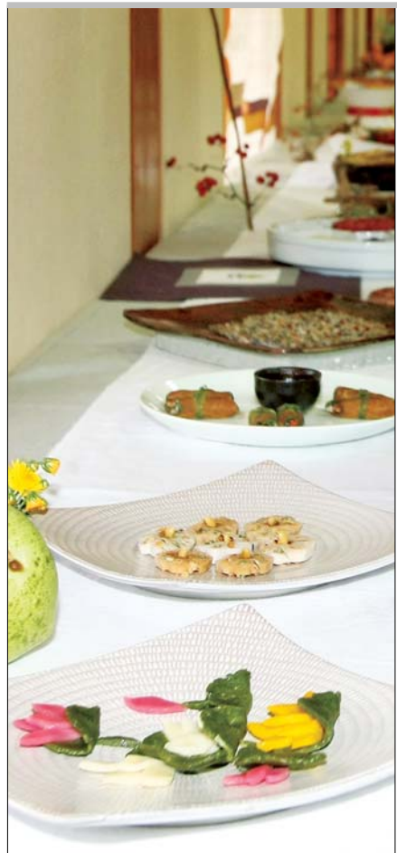
이번 봉녕사 사찰음식 경연대회에는 17팀이 참가해 자신들의 음식솜씨를 뽐냈다. 화려한 웃음으로 가을은 다양한 사찰음식들이 전시돼 있다.

17개팀 참가해 솜씨 뽐내고 다도 시연·장터서 사찰 체험 참가자들 절마당에서 맛있는 음식 먹으며 즐거운 한때