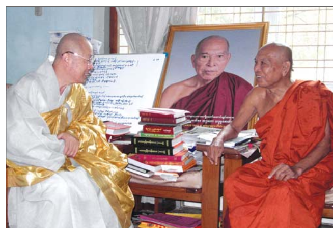
미얀마 연방승가회 총장