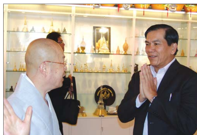
문화원 예방 외무장관