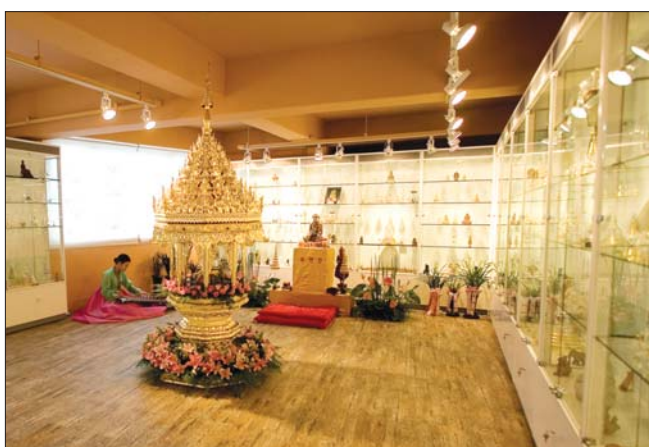
국제 붓다사리 박물관