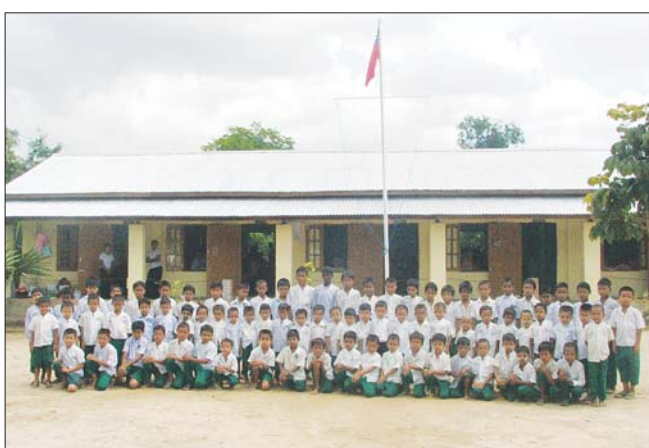
극빈지역 초등학교 설립 (수카까미 초등학교)

극빈지역 초등학교 설립, 빈약한 사찰 보수지원, 우물파기 운동, 승려 교육자료 지원, 극빈지역 출가익식 지원, 국제회의 개최 및 지원, 국제붓다사리 박물관 및 미얀마 연방정부 한국주재 문화원 개원(공식승인), 수해지역 복구지원, 학교건립 자선바자회, 이외에도 예술인 상호교류 공연, 교육자재지원, 아웅산묘지 폭파 순국선열 천도제, 비구니 스님 수행처 건립 제공 등 일일이 열거할 수 없는 많은 나눔의 행사를 봉행하여 왔습니다.