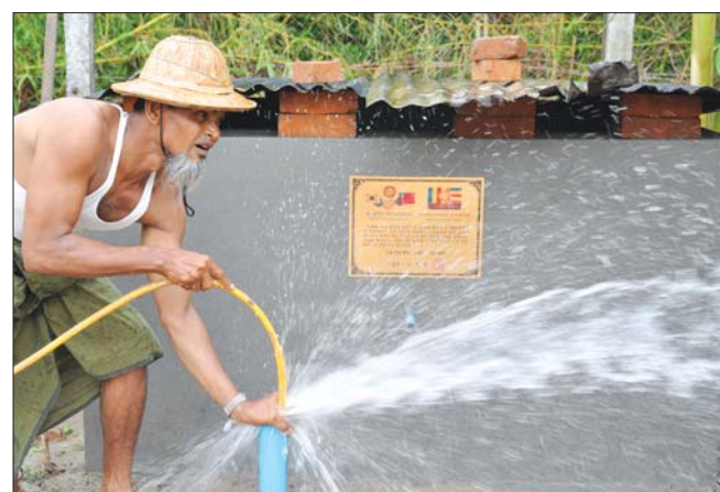
빈글라동 평간주지역 외 우물파기 운동