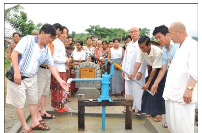
우물파기 운동 전개