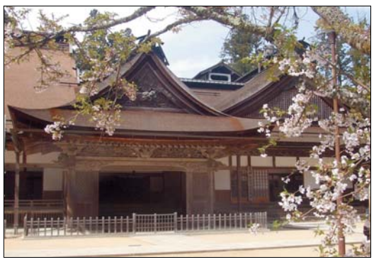
고야산 진언종의 총본산인 린고부지의 주전(主殿)