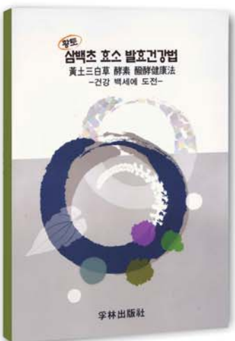
황토 삼백초 효소 발효건강법 부림출판사 | 감성목 지음 | 값 5,000원

노화와 난치병을 이기는 삼백초의 놀라운 효능! 변비, 숙변, 생리통을 없애는 날마다 기분 좋은 건강 비결! 간질환, 당뇨, 신장질환, 동맥경화, 고혈압, 심장병, 부인병, 비만 치료!