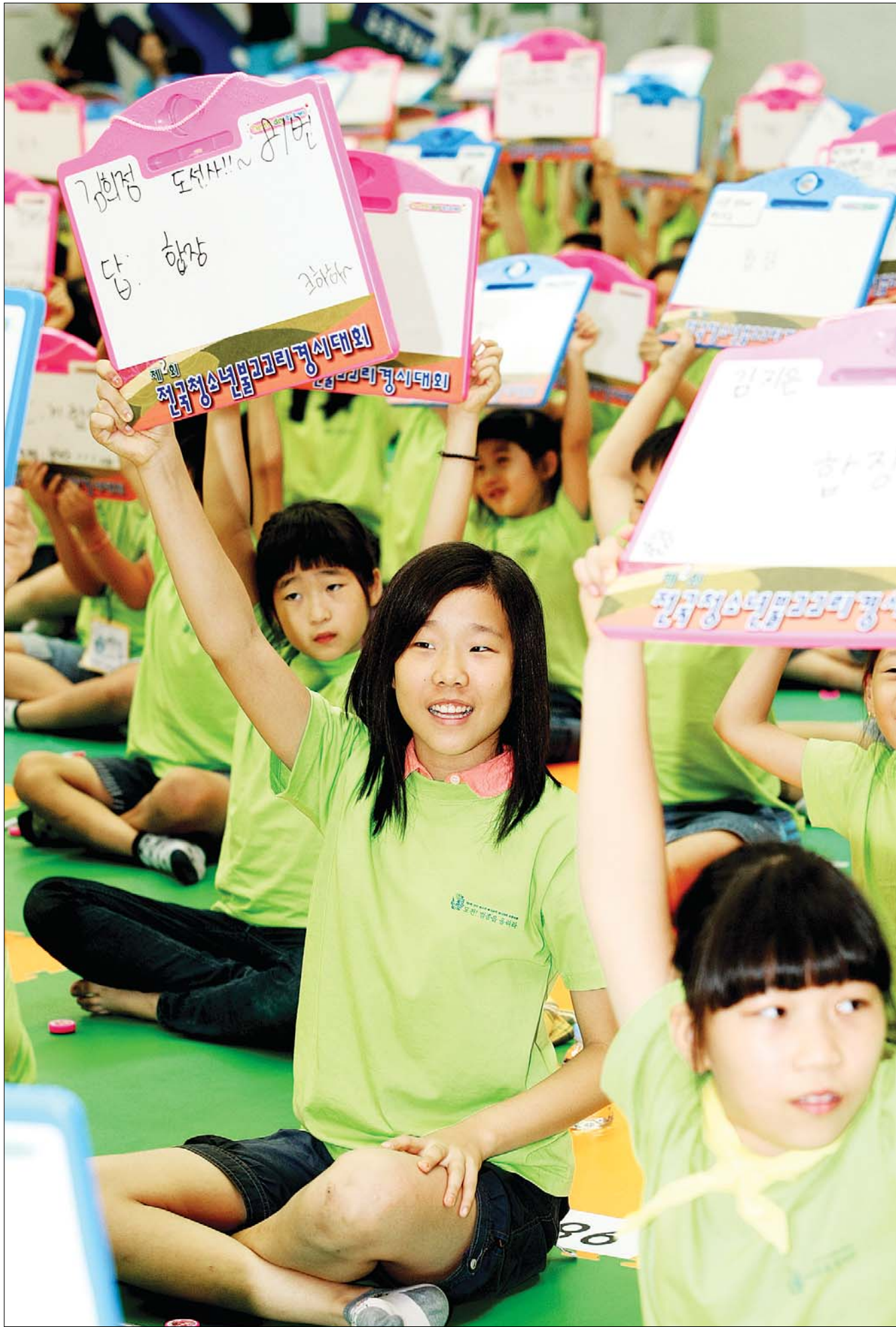
9월 11일 동국대 체육관에서 열린 제2회 청소년 교리경시대회 초등부 시험장. 참가학생들이 답을 써 놓게 들고 정답 발표를 기다리고 있다.