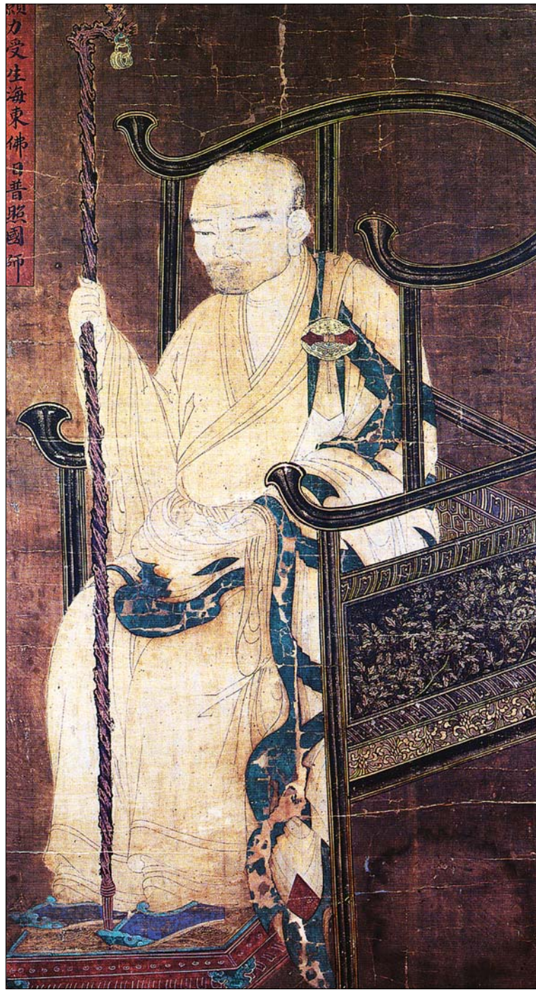
세계인의 스승 자들 스님 보조사상연구원(원장 법산)은 10월 7-8일 서울 법륜사 대웅전에서 '보조국사 열반 800주년 기념 국제학술대회'를 개최한다. 이번 대회에서는 한국·홍콩·중국·일본 등 국내외 학자 13명이 보조자들의 사상을 현대적으로 조명할 계획이다. 사진은 보물 제1639호로 지정된 통사 소장 보조국사 자들 스님 진영. 관련기사 7면