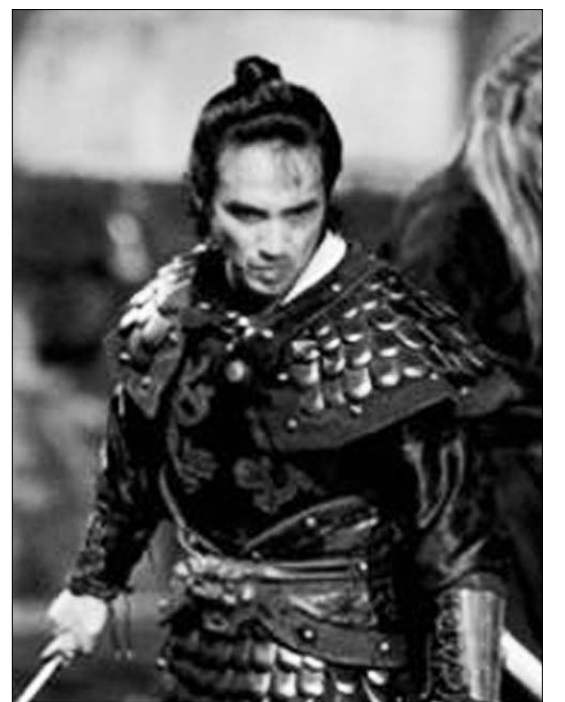
영화 청룡명월의 한 장면. 손목위의 팔에 방어용 토시를 끼고 있다.

르며 단련해야 합니다. 세상의 원리는 인간이 원하던 원하지 않던 그 둘은 언제나 지켜지고 있습니다. 노력하면 노력한 만큼 얻고 정도를 벗어나거나 그 준비가 확실하지 않다면 그 피해는 피할 수 없는 것 처럼 말입니다. 근본불교학자/ 다음카페: 37수도장