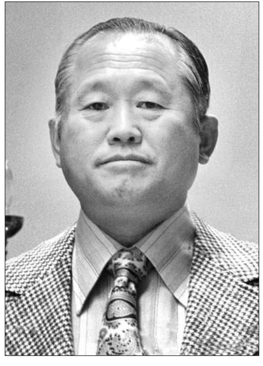
덕산 이한상(德山 李漢相 · 1917~1984)

#덕산 이한상(德山 李漢相 · 1917~1984) 덕산 거사는 재력이기면서 불교를 위해 자신의 재력을 어떻게 썼는지 우리에게 보여줬고 불교인으로서 자신의 신행생활에 얼마나 열거했는지도 알게 했다. 재력이 있는 사람이 많은 사람으로부터 "그 사람 가진 것을 참 뜻있게 쓰는 사람이야"라는 말을 듣기는 쉽지 않다. 또 많이 베풀면서도 티를 내지 않고 순수한 마음으로 보시하기란 정말 어렵다. 경기도 개풍군 임한면에서 4형제 중 2남으로 출생한 덕산 거사는 1938년 경기공업공업학교(경기공업전문학교 전신)을 졸업하고 일찍이 토건업에 투신해 자수성가한 사업가가 됐다. 덕산 거사와 친분이 남달랐던 박성배 교수(미국 스토니브룩대)는 덕산 거사를 "대학생 불교운동을 오랫동안 재직 지원했고 대학생 불자 수련대회를 통해 자기 신앙생활을 정리했으며 한국 불교 100년사를 편찬, 최근대 불교사를 정리하고 '불교신문'을 인수해 정상 궤도에 올랐다. 그리고 삼보화회를 조직, 장학사업을 했으며 현재의 일요법회 형식 절차에 절대적인 공헌을 했다. 또 미국에 와서 최초로 전통적인 사찰을 건립해 미주에서 한국 불교운동에 진력했다. 덕산 거사는 한국 불교 현대화에 큰 공헌을 한 분으로 한국 불교사에 기록할 만한 인물이다"고 술회했다.