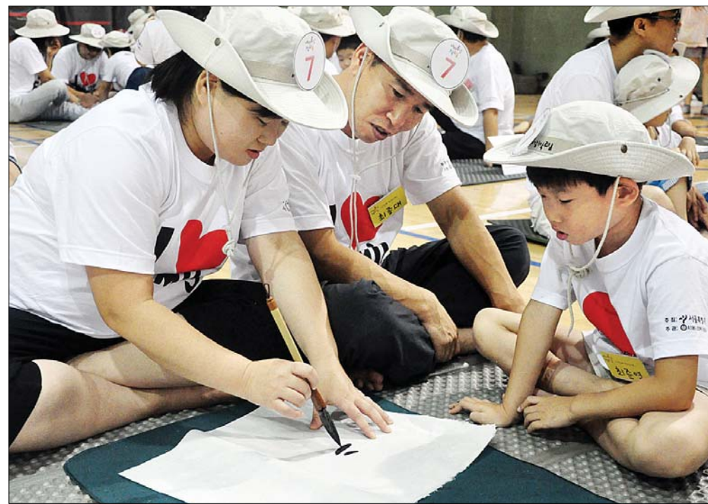
‘세대공감 과거제’ 모습. 사회자가 문제를 내면 가족들은 붓으로 화선지에 답을 적는다.