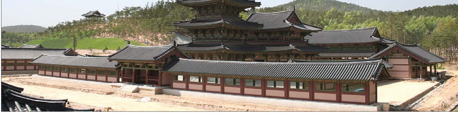
복원된 백제시대의 가람 부어 능사리사지(능사)의 전경.

국보 제287호 백제금동대향로와 국보 제288호 창왕명석조사리감 등이 출토됐던 부어 능사리사지(이하 능사)가 복원돼 찬란했던 백제 불교 문화를 선보인다. 공주 마곡사(주지 원혜)는 9월 11일 오후 1시 부어 백제재현단지 능사 대법당 앞 무대에서 백제능사 삼존불 점안식 및 개원대법회를 개최한다. 행사는 9월 18일~10월 17일 충남 부여군 및 공주시 일원에서 열리는 세계대백제전의 일환으로 마련됐다. 점안식은 오후 1시 증명법사인 주지 원혜 스님과 조계종 아산스님 3명이 진행한다. 오후 2시부터는 능사 대법당 앞 무대에서 개원대법회가 봉행된다. 개원대법회에서는 세계대백제전 조직위원회의 경과