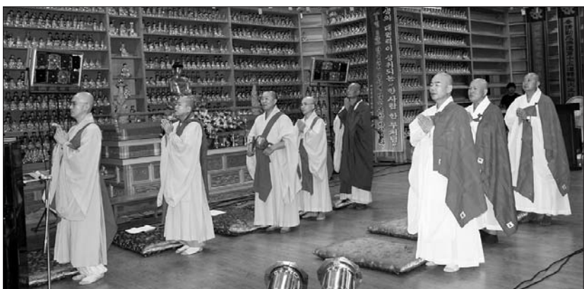
대구 법왕사는 8월 25일 삼장 백고좌대법회 전야 산사음악회를 봉행했다.

대구 법왕사는 8월 25일 대법당에서 제21회 100인 큰스님 초청 경·율·론 삼장 백고좌대법회 전야 산사음악회를 봉행했다. 법왕사에서 봉행되는 백고좌대법회는 한반도 평화와 민족통일을 기원해 마련됐다. 법회에는 <법화경>, <화엄경> 등 경·율·론 삼장 전반을 주제로 8월 27일부터 매일 오전 11시 30분에 법왕사 큰법당에서 100일 동안 병행된다. 조종섭 기자