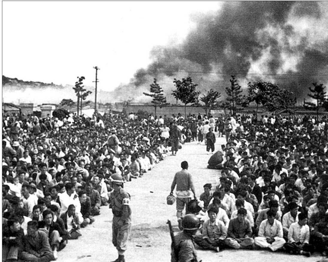
1948년 10월26일 여수 서국민학교에서 벌어진 좌익 협조자 색출 장면. 여수사건 기록물 중 가장 중요한 사진이다. 학교 너머 마을은 진압작전으로 불길에 싸여 있다.

여수는 해방공간에서 한국전쟁에 이르기까지의 지독하고 아픈 역사가 배인 도시입니다. 1948년 4월, 제주도에서 봉기가 일어납니다. 미군정을 반대하고 망국적 분단정부로 가는 단독선거를 반대하는 봉기였습니다. 서북청년단 등 외지의 극우세력이 가세한 진압대는 그 다음해까지 제주도민 5만여 명을 살해합니다. 이승만정부는 제주봉기 진압에 여수에 주둔하고 있던 국방경비대 14연대를 투입하려 하였습니