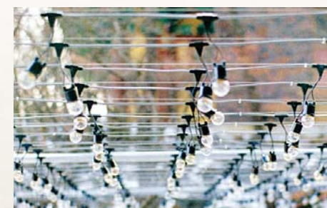
외부에 시공된 전선(케이블)