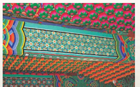
연등 설치 후