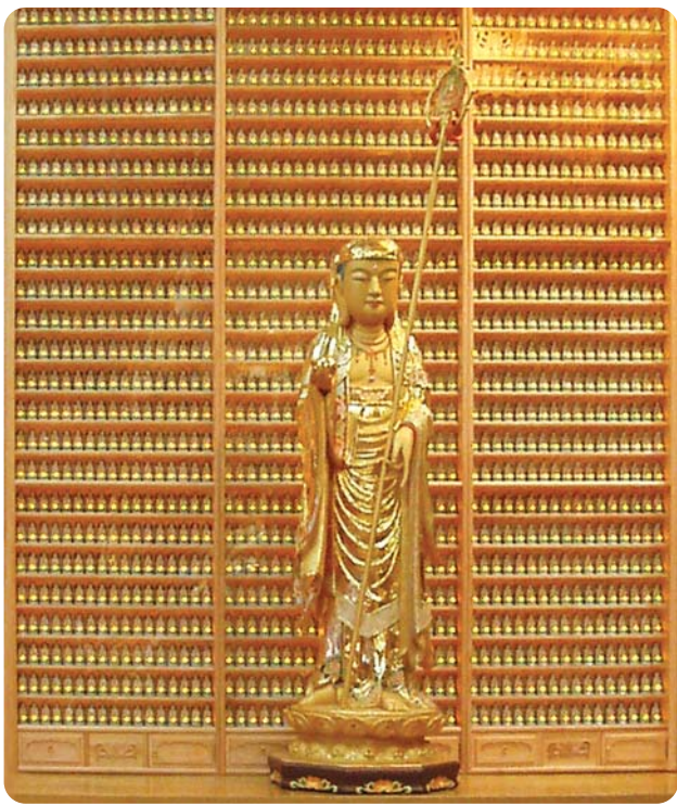
마산 금강정토사 LED 인등

찬덕불교가 개발한 새로운 개념의 신상품 영구위패 · LED 인등 · LED 전구