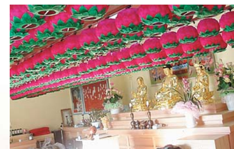
연등 자동 승강장치 _ 대구 여래사