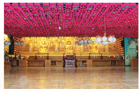
연등 자동 승강장치 _ 서울 화계사