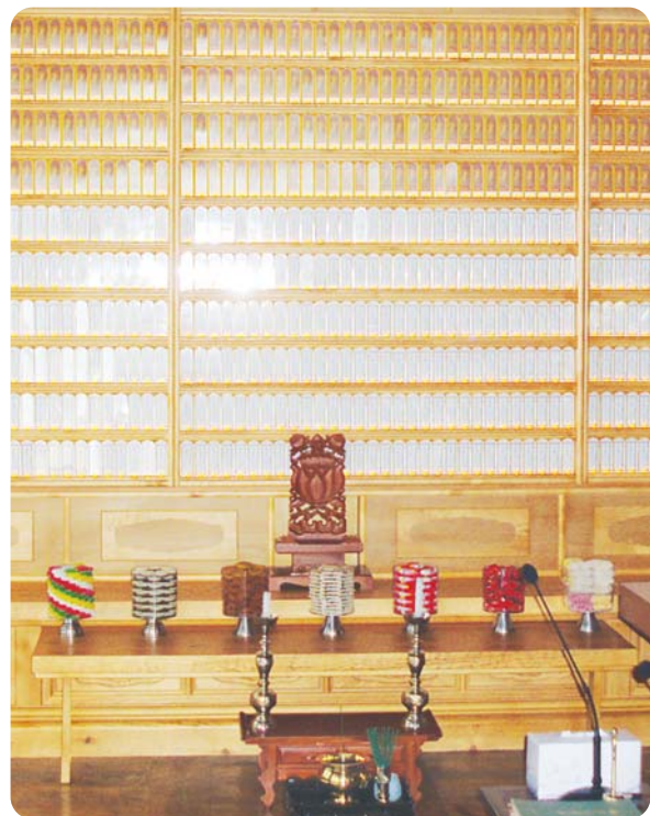
용학사 극락전 영구위패

찬덕불교에서는 KS케이블 을 사용하여 가장 안전하게 전문 기술인에 의해 직접 감독 시공합니다.