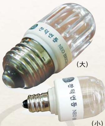
1년 365일, 하루 6시간 사용 전기요금: 98원/1kwh