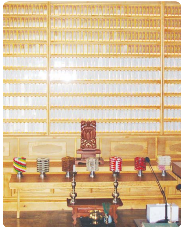
용학사 극락전 영구위패

찬덕불교에서는 KS케이블을 사용하여 가장 안전하게 전문 기술인에 의해 직접 감독 시공합니다.