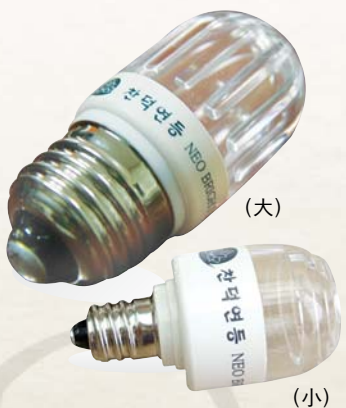
1년 365일, 하루 6시간 사용 전기요금: 98원/1kw