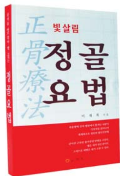
이재복 지음 (270면)

폐결핵으로 한쪽폐가 없어지고 간경화, 위궤양, 대장염으로 복수가 차서 피를 토하고 쓰러져 죽음의 문턱까지 갔던 사람이 병원에서 마저 쫓겨나 죽음을 기다리다 무심코 「발치기」운동으로 살아난후 세계최초로 창안한 활인건강법! "이운동으로 죽을 병고친사람, 몸이 더욱더 건강해진 사람, 정력이 변강쇠처럼 된 사람 무수히 많아, 누구든지 하기만 하면 제병을 제거고치는데 안하니까 문제여, 이운동은 무병장수할수 있는 최고의 운동이며,, (본문에서)