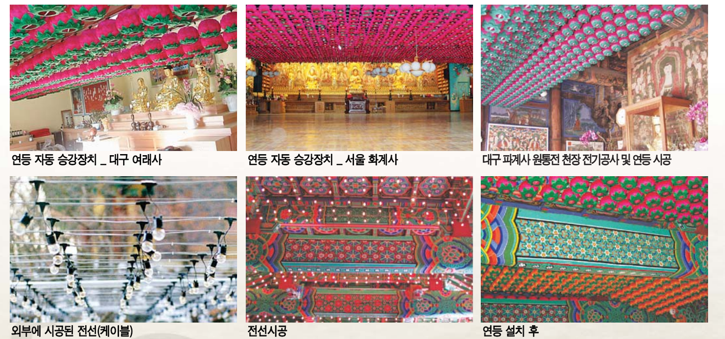
연등 자동 승강장치 _ 대구 여래사