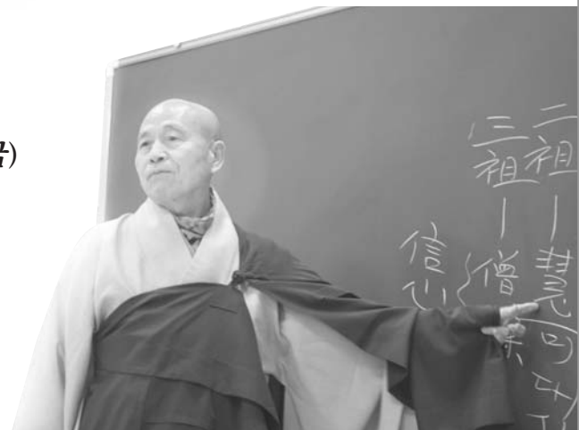
대한불교조계종 제16교구본사 고운사