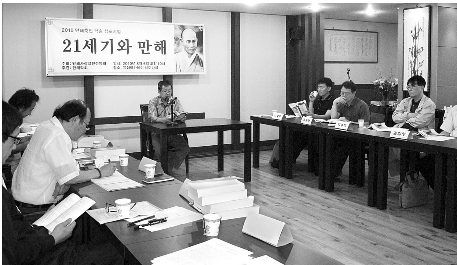
만해학회와 만해사상실천선양회는 8월 6일 서울 만해학회 사무소에서 ‘21세기와 만해’를 주제로 세미나를 열었다.