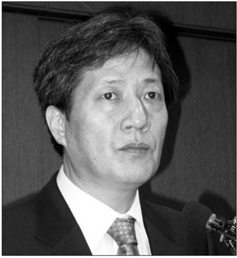
대안 없는 목소리는 힘 없다

불교계 연구네트워크가 창립을 눈앞에 두고 있다. 연경사회문화정책연구네트워크(이하 연사연)는 최근 개신교계 단체의 불교 폄하 광고를 반박하고 종교사학 예산지원 현황분석 결과를 제시하면서 모습을 드러냈다. 연사연은 7월 22일 발표에서 교육부가 국회에 제출한 종교사학 예산지원 현황을 분석하고, 현행 사립학교법에 근거한 현황을 밝히는 등 구체적인 연구 데이터를 제시해 눈길을 끌었다.