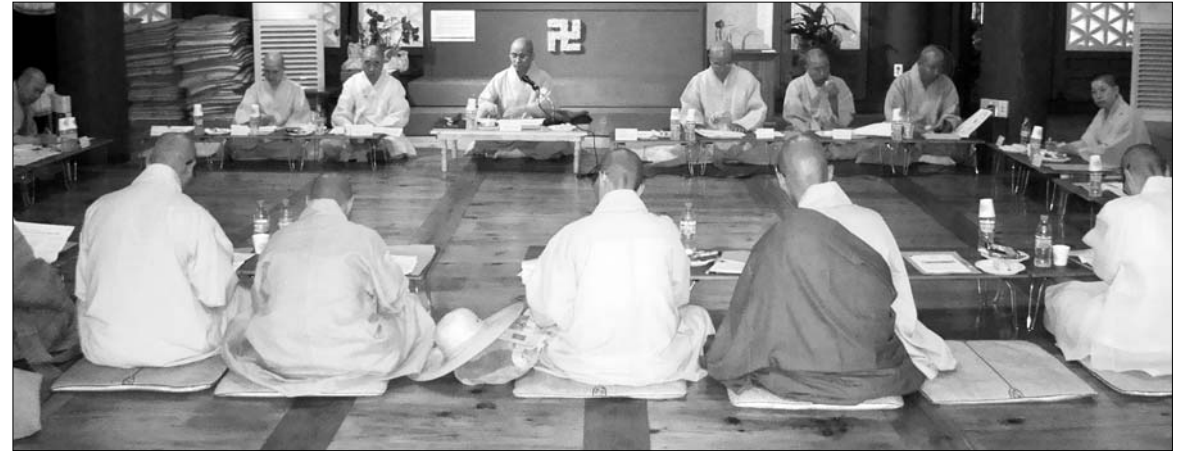
7월 29일 동국대 정각원에서 열린 석림동문회 긴급 임원 간부회의 모습.

조계종 교육원(원장 현용)이 “동국대 승가 기본교육기관에서 제외하겠다”고 밝힌 것과 관련해 동국대 석림동문회와 불교대학 교수들이 강하게 반발하고 나섰다.