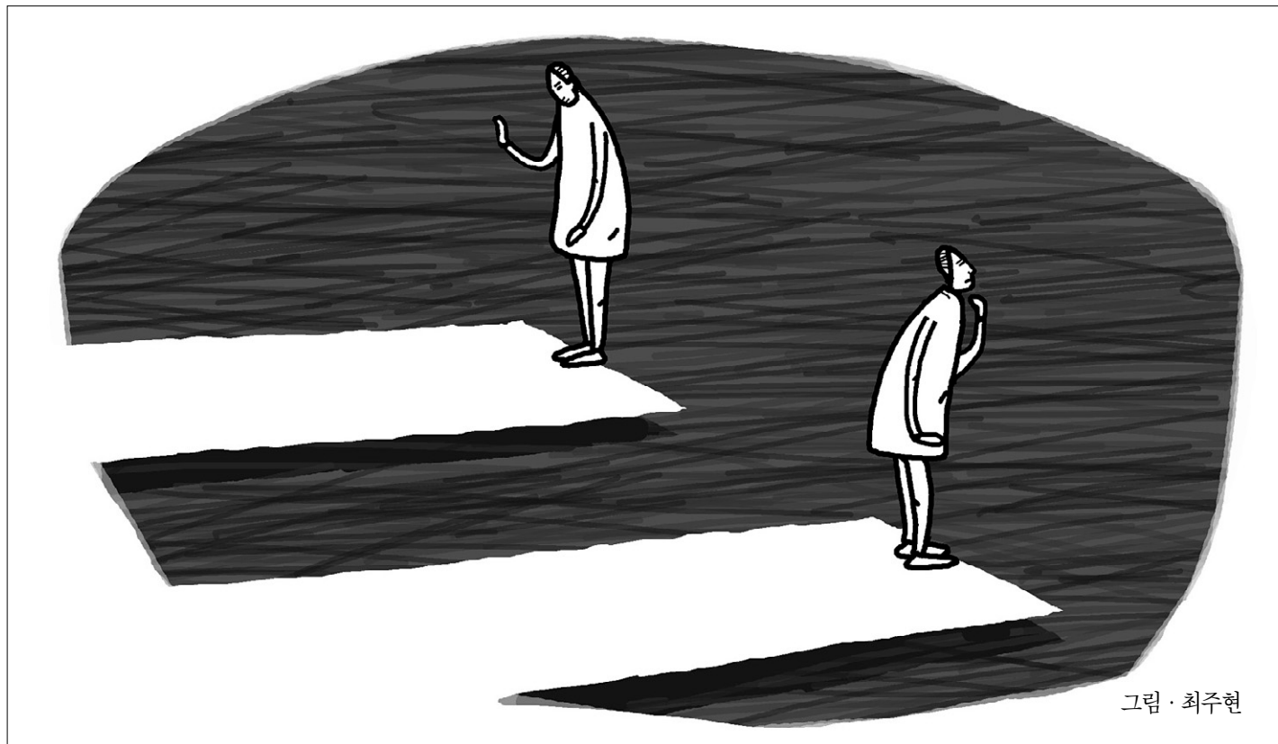
그림 · 최주현

그런데도 부처님 법은 자기와 동떨어져 있다고 생각하고 '나는 중생이니 부처님의 그 묘한 법, 광대무변한 법은 모르다.'고 생각을 하시죠? 여러분이 고등 동물로서, 한 인간으로서 태어난 것은 그전에도 얘기했지만 수억 겁에 걸쳐 '아, 이런 거는 잘못된 건데...' 하고 반성하고 고치면서 살아오던 과정을 거쳐서 현재 인간에 이르기까지 진화되면서 마음을 그렇게 지혜롭게 했기 때문입니다. 또 마음