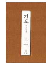
기도, 내려놓기 법륜 스님 지음 정토출판 펴냄 | 8500원

오세암의 달밤 | 정관 스님 | 부다가야 불자들의 순례지인 오세암에 대한 진지한 이야기를 시작으로 출가자로서 평소 생활하고 수행하며 느꼈던 이야기를 잔잔한 문체로 그려내고 있다. 넓고 깊은 사색이 배어 있는 이야기들을 통해 때로는 구도정신을 일깨우고, 때로는 삶을 성찰하게 한다. 아울러 불자로서의 마음가짐에 대해 생각하게 하고 있다. 나아가 사소한 일상에서 인생의 참된 의미를 느끼게 하는 계기를 선사한다.