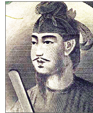
구(舊) 일만 엔 지폐에 사용된 쇼토쿠 태자의 초상화.

역사적인 면에서는 일본 최초의 여왕인 스이코(推古) 왕의 섭정으로 인정되어 앞의 헌법을 제정, 고대국가의 기틀을 확립했다는 점, 관위 12계를 제정, 인재를 고