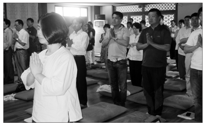
웰빙108클럽의 회원들이 창단식이 열린 7월 22일 한암사 큰법당에서 백팔대 참회로 DVD동영상을 보며 108배를 하고 있다.