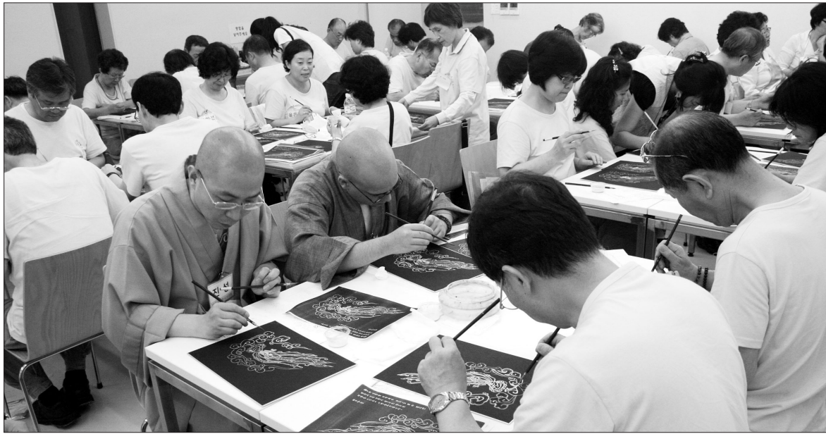
제10차 국제포교사대회에 참가한 국제포교사들이 행사 첫째날 불화그리기를 체험하고 있다.

이번 국제포교사 대회에는 조계종, 회원종단, 해외거주 포교사, 실무진 등 100여 명이 참가한 가운데 국제포교사의 역할에 대한 논의를 중심으로 진행됐다. 행사는 해외 국가의 성공적 포교사례, 해외포교의 동향 파악, 국제포교사의 정보공유 등 국제포교사의 동기부여와 재교육의 기회로 활용될 수 있는 프로그램들로 구성됐다. 해외불교에 대한 이해증진 프로그램으로는 △동국대 티벳 대장경 연구소 계세 텐진 남카 스님의 티벳 불교에서 배운다-티벳 불교의 현황과 해외포교 성공 사례 △미국 이종권 포교사의 미주를 중심으로-한국불교 국제화를 위한 포교사의 현황과 방향 그리고 역할에 대해 강의했다.