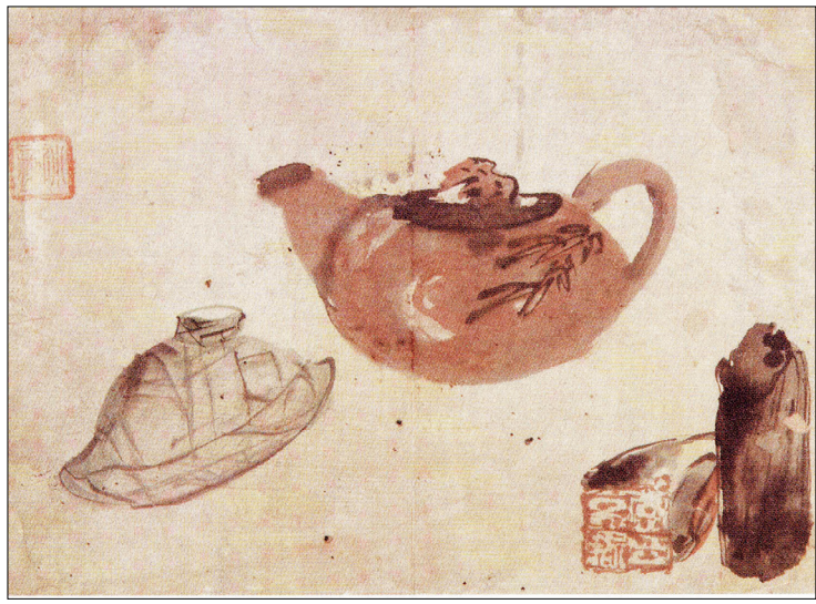
허련 '기명도(器名圖)'. <한묵청연(翰墨淸緣)> 중이에 담재. 18.4×25.4cm, 개인 소장.

허련은 김정희가 제주도에서 유배생활을 할 적에도 여러번 찾아가 함께 생활하면서 한편으로는 그림 공부를 계속했다. 그 와중에 김정희의 소개로 신관호, 권돈인 등과 교분을 쌓으면서 활발하게 그림을 그렸다. 허련의 나이 41세에는 현종계 입시(入侍)하여 서화를 품평하고 그림을 그리는 등 일생에서 가장 영광스러운 순간을 맞기도 했다. 김정희의 집에서 함께 수학한 여러 문인 등과의 교류 외에도 명문사대부들과의 만남과 교류는 그의 예술에 폭과 깊이를 더해 주었다. 이러한 일들을 가능케 한 것은 스승인 김정희의 든든한 후원이 있었기 때문이고 그의 빼어난 그림 솜씨가 있었기에 가능했다.