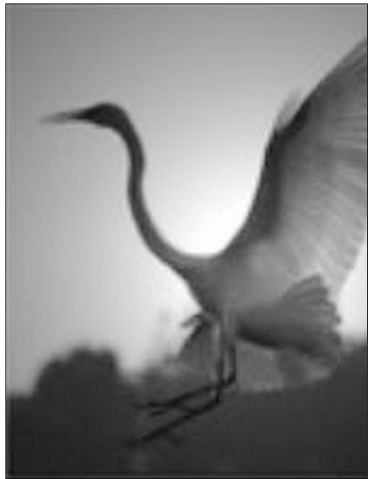
백학권은 백학의 형세를 취하여 만들었다.

백학권은 '고랑보'라는 특이한 보법이 있습니다. 이 보법은 여자가 사뿐히 걷는다는 의미에서 따온 보법으로 백학권을 익히는데 있어 아주 중요한 보법입니다. 백학권은 자세가 좁고 움직임이 크지 않습니