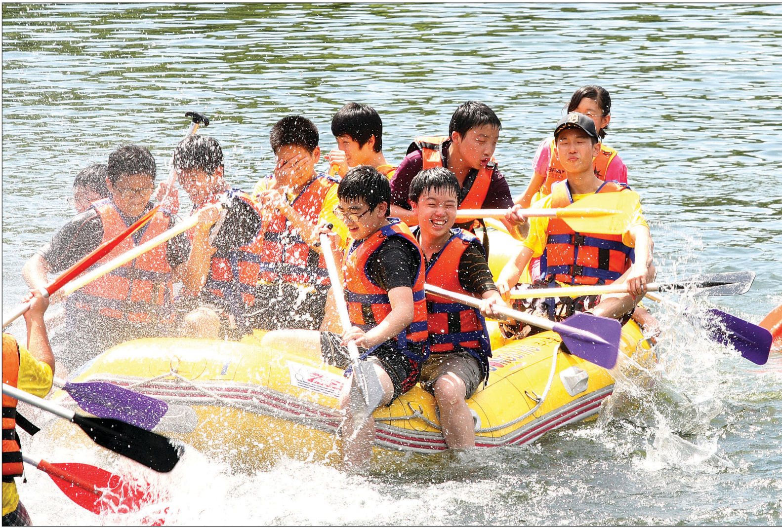
“아호! 여름이다” 불심도 기르고 물놀이도 하고 파라미타청소년연합회(회장 도후)는 7월 20~23일 보은 범주사와 유스타운에서 '제13회 파라미타 청소년 전국연합캠프'를 개최했다. 여름방학을 맞은 청소년들에게 불교문화체험과 건전한 어울림 활동을 통해 바른 심성수련과 호연지기를 키워주기 위해 마련된 이번 캠프는 청소년 1250명과 지도자 150명이 참가한 가운데 발우공양, 108배, 부채 만들기, 수상활동, 음악놀이페스티벌 등 다양한 프로그램이 진행됐다. 박재완 기자