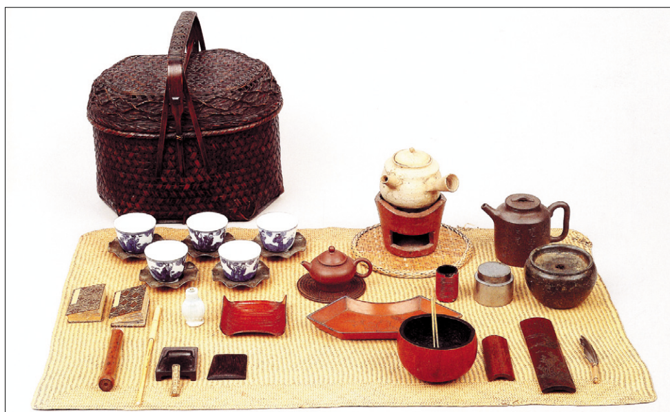
전다제람개구(煎茶提籃茶具), 교토국립박물관 소장. 제람(提籃)의 높이 22.1cm 폭 20.7cm.

그가 차를 팔 때의 이야기는 “교토 외곽의 산기슭 소나무 아래 낮은 모습을 한 노인이 나타나 소박한 다점(茶店)을 열었다. 가게 이름을 통선정(通仙亭)이라 하고 가게 앞에는 ‘청풍(淸風)’이라고 쓴 기를 매달았다. 또한 가게 앞에 ‘차값은 황금 100냥이든 반 푼이든 주는 대로 받습니다. 그냥 마셔도 좋지만 공짜보다 싸게는 안 됩니다’라고 적어놓았다. 게다가 백발이 성성한 노인은 중국풍의 의상을 걸치고 차를 파는 이상한 모습이였다. 얼마 안 있어 그 노인은 봄이면 경치 좋은 꽃길 아래, 여름이면 시원한 개울가로, 가을이면 단풍나무 아래로 옮겨 다니며 차를 팔았다”라고 전해진다. 이러한 바이사오의 차를 파는 행위는 출가는 했