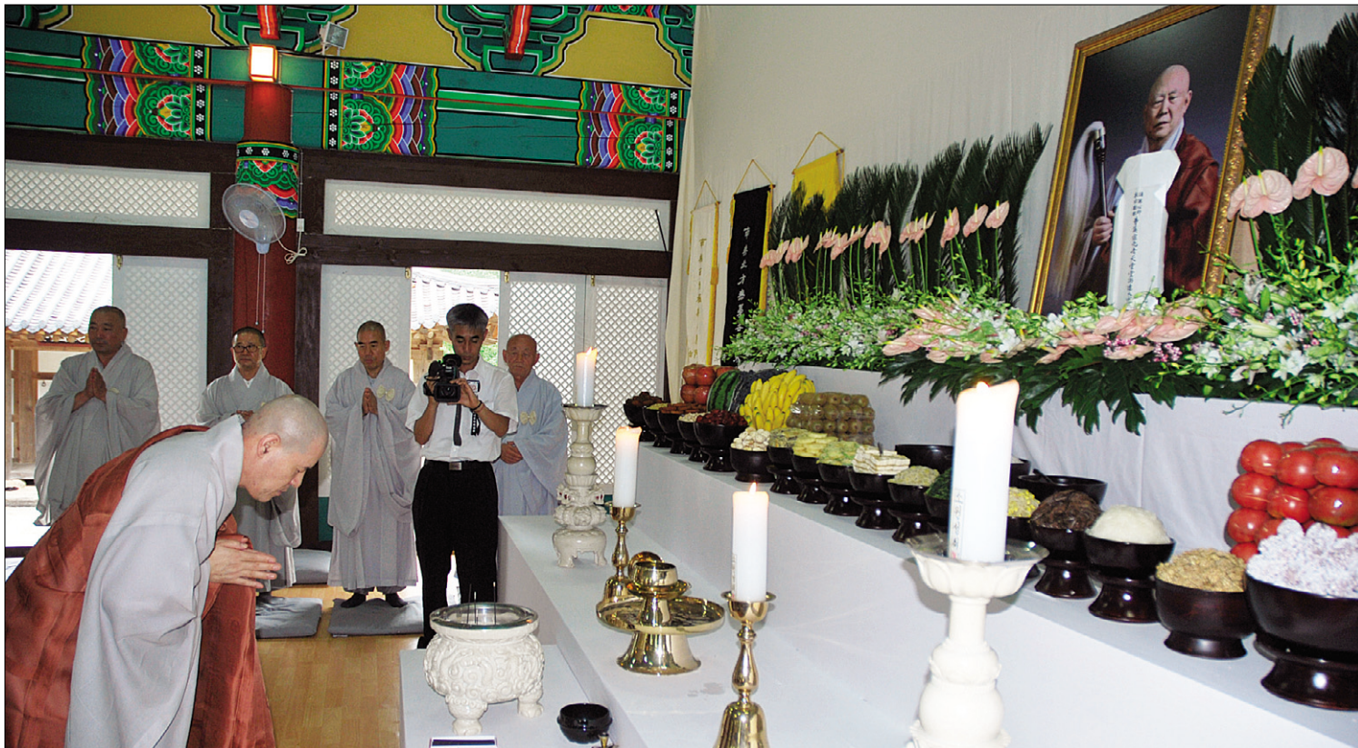
조계종 총무원장 자승 스님이 7월 16일 해남 대흥사에 마련된 천운 스님의 빈소를 찾아 조문하고 있다.