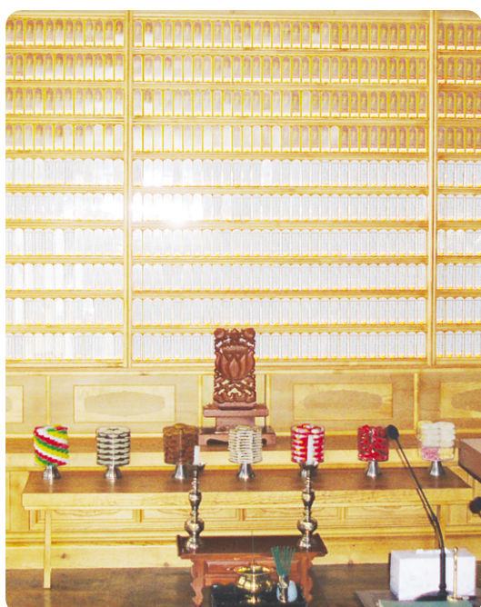
용학사 극락전 영구위패

찬덕연등에서는 KS케이블 을 사용하여 가장 안전하게 전문 기술인에 의해 직접 감독 시공 합니다.