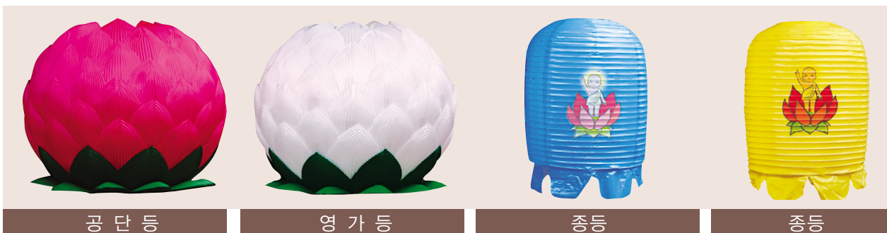
공 단 등