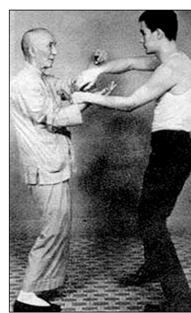
염문 노사와 이소룡.

어느 날 영춘이 울고 있는 것을 목격한 오매 선사가 이유를 묻자, 영춘은 마을의 불량배가 자신에게 그의 아내가 될 것을 강요했다고 말했습니다. 이 일